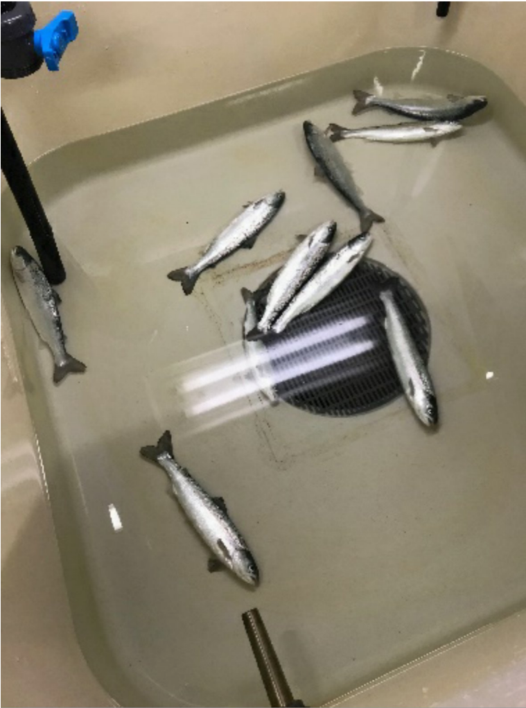
Bilde 1. Laks opplever kuldesjokk og ligger på bunnen av karet etter noen minutter ved -1 °C.

temperaturendringen er mindre. I et senere forsøk med fisk overført fra 8 til 0,5 °C ble det ikke observert immobilisering.