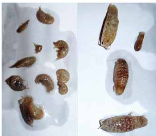
Figur 2. Tmetonyx cicada til venstre og Cirolana borealis til høyre.