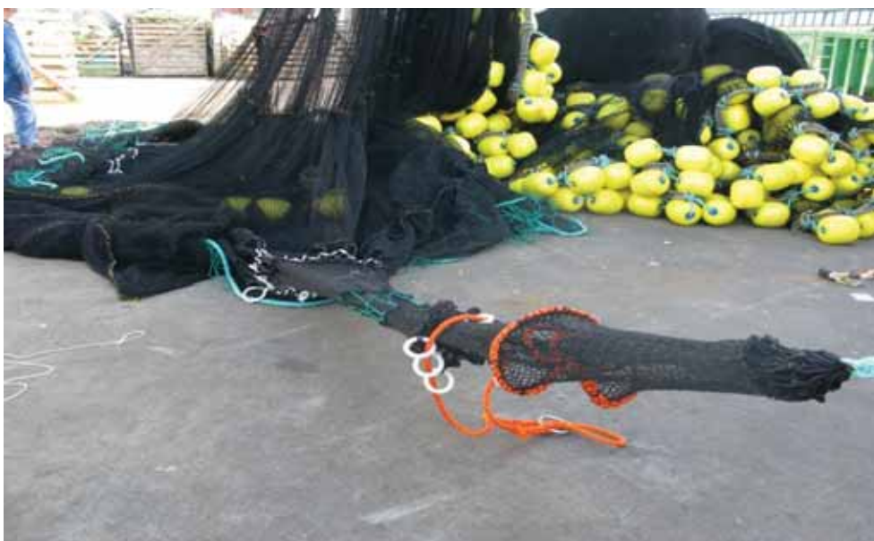
Figur 2. Oppsamlingssekk i kisepanel 1.