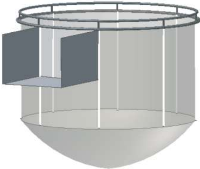
Figur 1. Skjematisk teikning av merd med kanal som vart konstruert til forsøka.

Merddar med stiv ramme (doble PE-rør, 200 mm og rekkverk) og ein indre diameter på 12 m vart laga i 2006. Nettet hadde maskevidde 35 mm og var laga i tråd No. 14 EK, typisk for tørker i mange nøter. Brysttauet var i 12 mm Danline. Ein stor inngangskanal, 4 m djup, 6 m vid og 6 m lang vart laga i merden og i brystet på nota. Merden hadde 8 m djupe veggjar, med konisk botn som ender i ein spiss ved 12 m djup, altså 4 meter djupare enn veggjen. I botnen vart det tilrettelagt for å bruke "kinahatt" til LiftUp pumpesystem for å fjerne daudfisk (Figur 1).