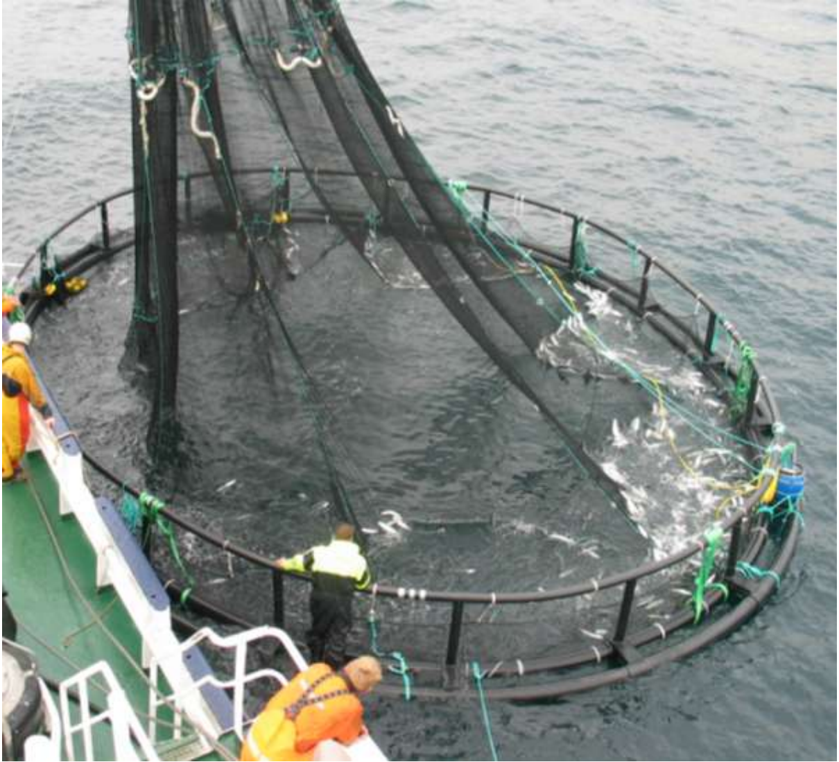
Figur 2. Delvis tørking av merd i 2. parallell i 2006.